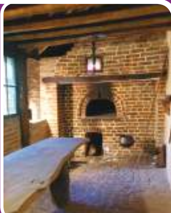
LE FOUR A PAIN 6,90 € par personne

(sur réservation, minimum de 20 personnes, de 11h à 11h45)