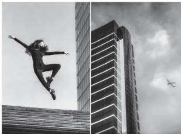
Demain dès l'aube...